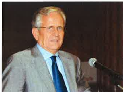
Andreas Unterberger blickt im Zorn auf die herrschende Politik und will der direkten Demokratie zum Durchbruch verhelfen.

Der renommierte Journalist Andreas Unterberger gilt als Konservativer, als Liberaler, aber sicher nicht als Radikaler. Der Titel seines neuesten Buches, das am Donnerstagabend in der Wiener Buchhandlung Frick präsentiert wurde, klingt aber ganz so: „Schafft die Politik ab!“, fordert Unterberger da, und der Leykam-Verlag bezeichnet das Werk auf seiner Webseite als „Aufschrei des Zorns“, als „Frustration eines langjährigen Analytikers, einstigen EU-Vorkämpfers und Politiker-Verteidigers über das zunehmende Versagen der repräsentativen Demokratie“.